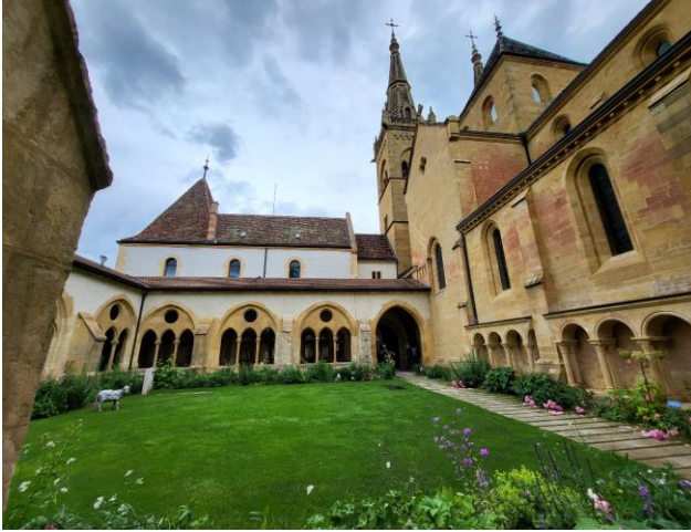
Kollegiatkirche in Neuenburg

Die EKS-Ratspräsidentin Rita Famos betonte die geistliche Dimension der Kirche. Im Anschluss an die Verhandlungen fand ein feierlicher Gottesdienst in der Kathedrale (Collégiale de Neuchâtel) statt.