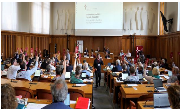
Verhandlungen der EKS-Synode

Am Montag-Nachmittag und am Dienstag-Vormittag erfolgten dann engagierte und kritische Diskussionen zum Massnahmenpaket zur Aufklärung und Prävention von sexuellem Missbrauch sowie insbesondere zur Dunkelfeldstudie, welche vom Rat EKS vorgeschlagen wurde. Die Synode sprach sich dann aber gegen die Durchführung einer nationalen Dunkelfeldstudie aus.